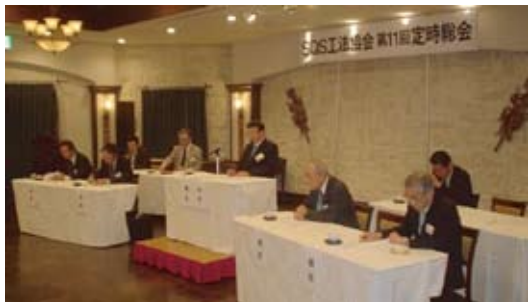
総会決議について真剣に討議する執行部 SQSシステム協会新組織図